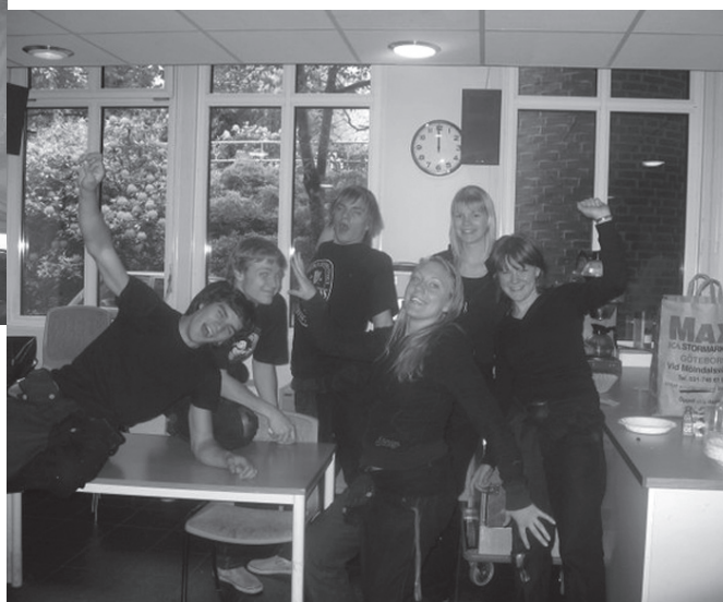
Så här glada var KJKb-6 -07 på den tiden då de fortfarande var sittande.