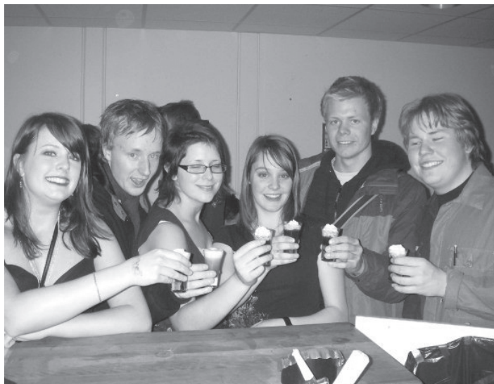
Så här glada var b0f-08 när dom var på pubbrunda