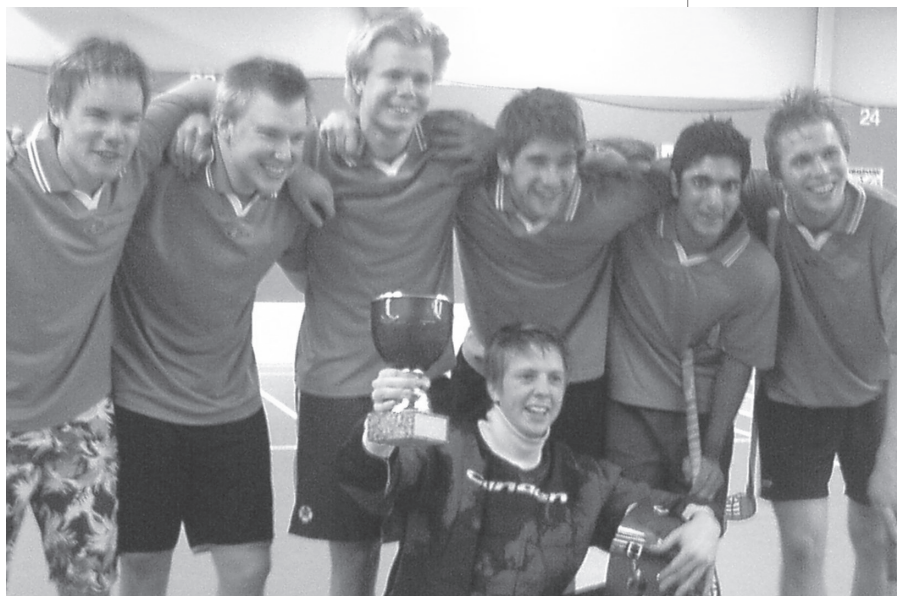
Så här glada var KJK efter att ha vunnit CM i innebandy